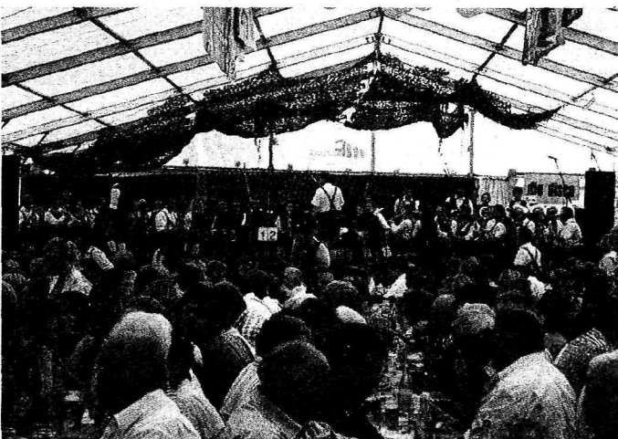
Auch das zeichnet Michaelnbach aus: Wenn ein Fest angesagt ist, dann geht es rund. Denn die Michaelnbacher wissen Geselligkeit immer wieder zu schätzen.

betreut. Für die weitere schulische Ausbildung nach der Volksschule nutzen die Jugendlichen vor allem die Bildungseinrichtungen in Grieskirchen. Die Freizeitbetreuung findet in den aktiven Vereinen statt. So hat die Michaelnbacher Landjugend sogar einen eigenen Treff gebaut, die Jungschar wiederum trifft sich im Pfarrheim. Für die älteren Mitbürger bietet der Seniorenbund ein umfassendes Aktiv-Programm mit Ausflügen und Wanderungen. „Essen auf Rädern“ gehört für all jene zum