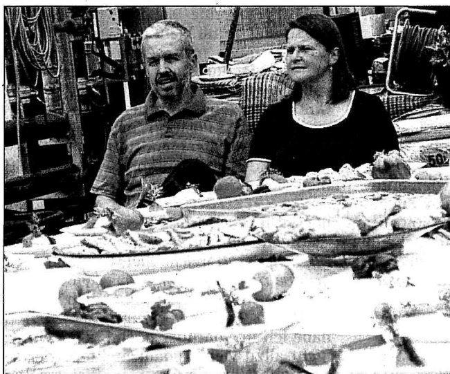
Bild mit ausgesprochenem Seltenheitswert: Das Klarlbauerpaar im Sitzen.