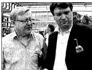
Grüner Hirz mit grüner Paprika, schwarzer Bernhofer mit schwarzer Paprika.