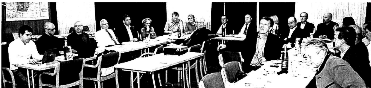
Die Agenda21-Gruppen stellten ihre Ideen im Rathaus Vertretern der Politik vor.