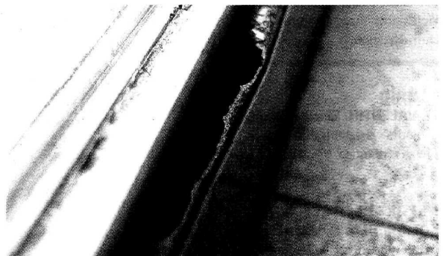
Das alte Marktgemeindeforum zeigt schon schwere Schäden.